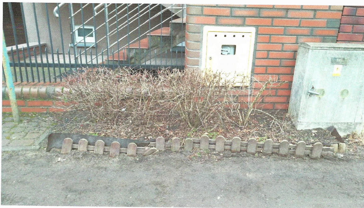
E. Berberys zwyczajny Berberis vulgaris