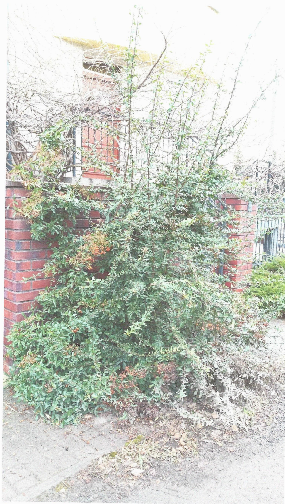
C. Ognik szkarłatny Pyracantha coccinea

Budowa fragmentu ulicy Gersona (dz. nr ew.: 61, 65, 83, 85, 86, 87 obr. 88 oraz 79 obr. 93 m. Bydgoszcz) na os. Górzyskowo w Bydgoszczy – etap I.